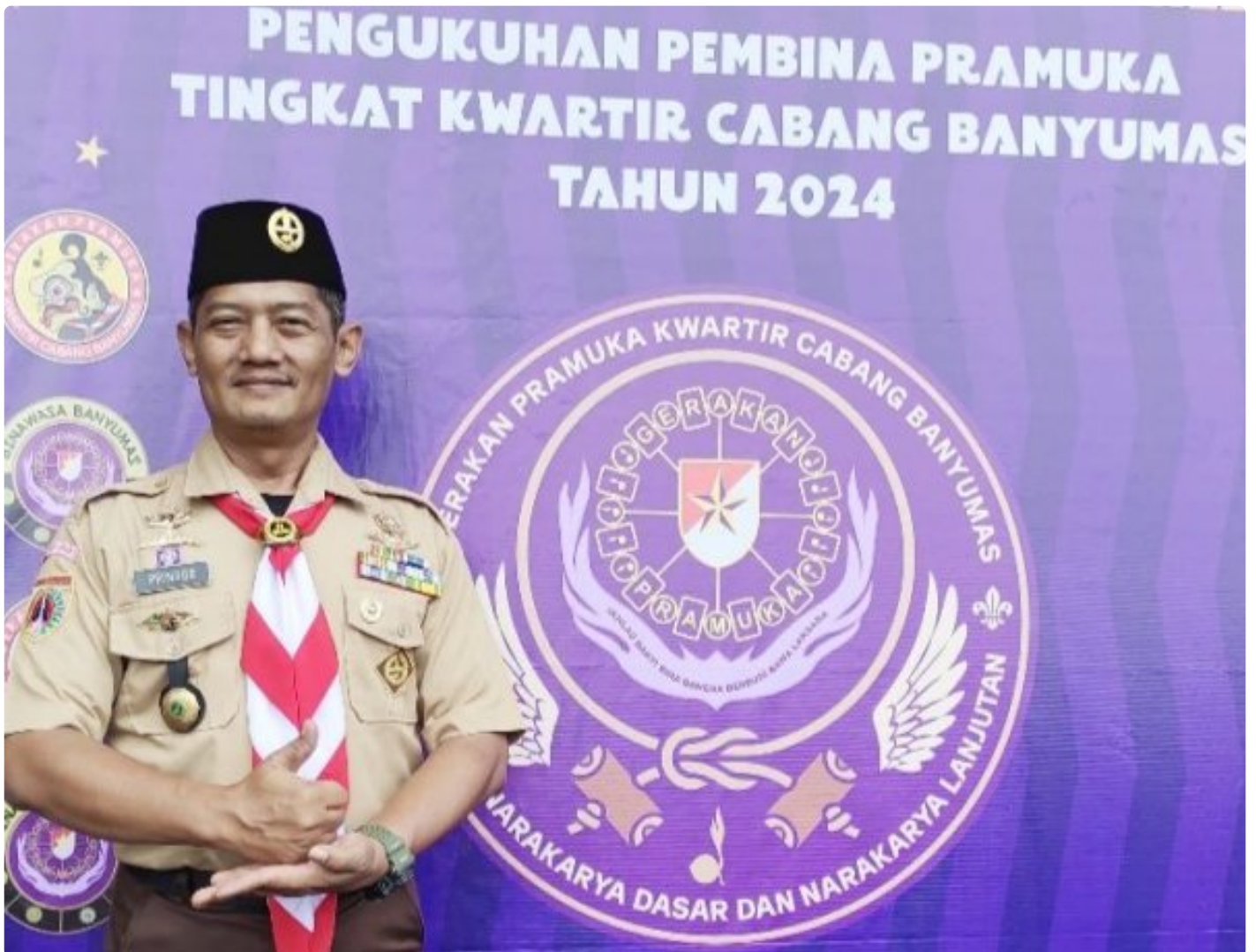
Kapenrem 071/Wijaya Kusuma dikukuhkan sebagai Pembina Pramuka Kwartcab Banyumas